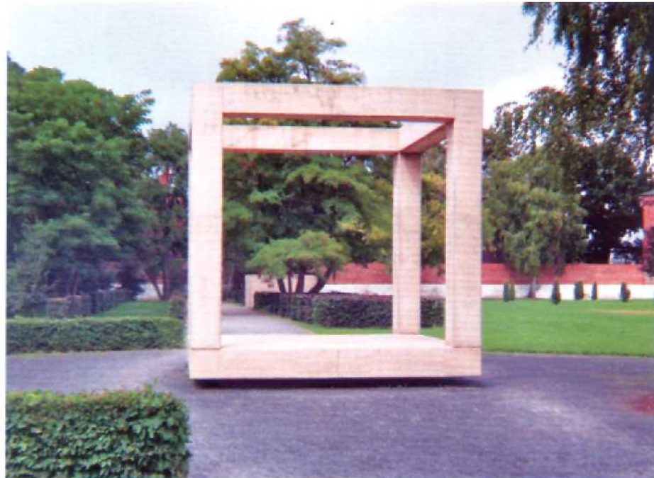
Vagttårnet (Panoptikon) er kvadratisk og funktionelt. Det benyttes som bænk. Gennem tårnets åbne sider kan man overskue parken 360 grader rundt.

Park og bygning er ikke billede på modstillingen natur og kultur, men på krop og rum. Arkitekturens ordnende princip (muren) omkranser sin egen fragmentering (enkeltcelle, gårdcelle) som henvisning til en sammenbrudt orden. Hele par-