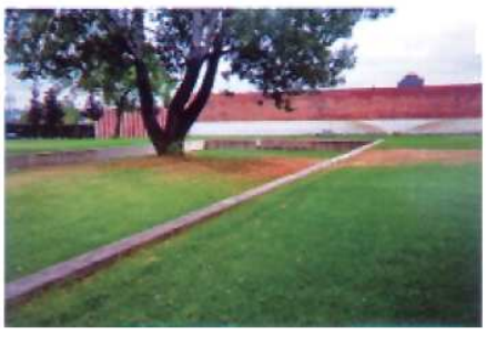
Stenene angiver én af fængselsfløjene, med træet genskabes samspillet mellem struktur og natur. Naturens og tidens forandring symboliseres af træets vækst.

Totale institutioner er i Goffmans optik sociale hybrider: dels et opholdssted, dels en formel organisation, Goffmans pointe