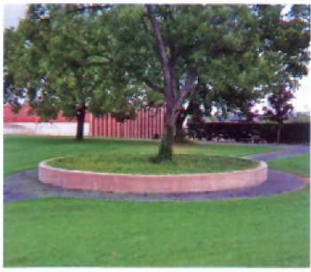
Cirklen indikerer en af de nedrevne gårdcirkler.

er, at restriktioner omkring kontakt er med til at opretholde antagonistiske stereotyper (indsat-personale, fri-ufri). I Zellengefängnis Moabit opererede man med restriktioner omkring syn og sansning: De indsatte opholdt sig i isolation, ved transport på området var de iført en hat med en skygge, der kunne klappes ned, så der ikke kunne modtages synsindtryk. Under skole- og kirkegang var de indsatte anbragt i lodret stående kasser, der kun gav udsyn fremad. Kontakt er en menneskelig nødvendighed, og derfor tyede de indsatte til banke-