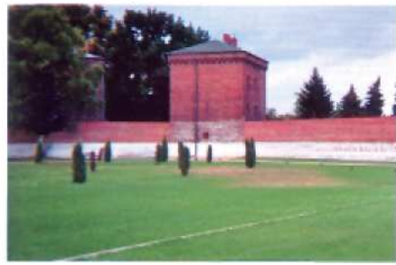
Træerne symboliserer indsatte på gårdtur. Deres placering angiver dimensionerne på den cirkel, hvor de indsatte var på gårdtur. Man må forestille som gårdcirklen som et hjul med eger, der opdeler hjulet i eksakt lige store dele.

er, at restriktioner omkring kontakt er med til at opretholde antagonistiske stereotyper (indsat-personale, fri-ufri). I Zellengefängnis Moabit opererede man med restriktioner omkring syn og sansning: De indsatte opholdt sig i isolation, ved transport på området var de iført en hat med en skygge, der kunne klappes ned, så der ikke kunne modtages synsindtryk. Under skole- og kirkegang var de indsatte anbragt i lodret stående kasser, der kun gav udsyn fremad. Kontakt er en menneskelig nødvendighed, og derfor tyede de indsatte til banke-