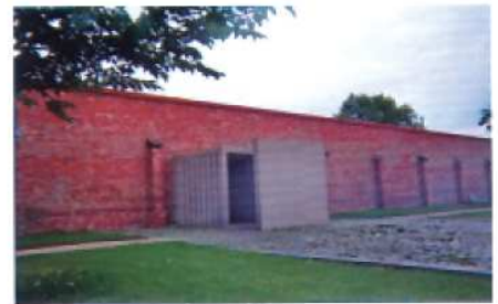
Selv indgangen til parken er dækket og dermed delvist skjult. En henvisning til Haushofers digttat på muren, hvori ordet "gitter" optræder.

en fortælling om, at indespærringen er en skjult klang i det samlede oplevelsesforløb. Langs en linje - længdeaksen i hovedbygningen - ligger 1) klanginstallationen, 2) det stiliserede vagttårn i parkens midte, som er et åbent rum, men præget af den autoritære geometri og 3) stjerneclabyrinten, der er formet som en horisontal labyrint med vertikale steler, der henviser til cellevæggene. Astronomiske stjernebilleder og en skulptur med de astrologiske stjernebilleder sammenkobler livsbanens (stjernebilde) endelighed med rummet uendelighed.