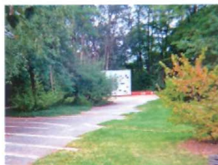
Mellem klatrevæg og stjerne-labyrint er nedlagt fliser i et uensartet mønster, der både henviser til cellestrukturen og til labyrintens smalle gange.

sovn, fritid og arbejde, er nedbrudt, og den enkeltes rum kontrolleres. Den funktionelle institutions resultat var et anonymiseret, depersonaliseret individ, og synliggørelse og skjulthed præger parkens