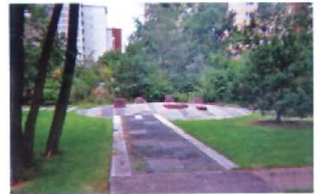
Skulpturen er skabt af fundne materialer og fra andre bygninger andre steder i Berlin. Man kan se skulpturen som udtryk for en nedbrudt orden, men også som en serie af henvisninger til andre steder, så fængselsstrukturen overskrides.

"Panoptisk" betyder, at bygningen kan overskues fra ét bestemt punkt. I dette tilfælde vagttårnet i parkens midte.