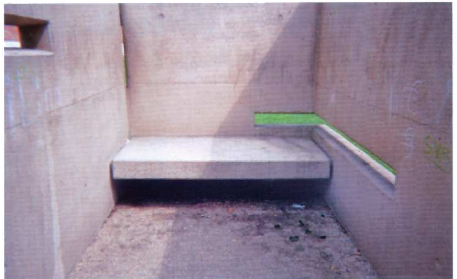
Christiane Keplers klanginstallation i isolationscellen er bygget efter en autentisk enkeltcelles mål. Gennem små spalter i cellevæggen kan man se ud på parken, men ikke selv observeres.

Efter englænderen Benthams panoptiske forbillede bestod cellefængslet udelukkende af enkeltceller og gårdceller. Fangerne var i streng isolation og blev under gårdturen overvåget fra centralbygningens vagttårn. Datidens myndigheder mente, at kriminalitet overføres ligesom sygdomme, og isolation ansås for en i kriminologisk henseende effektiv behandlingsmetode. Fængselsfløjene, skolen, sindsygehospitalet og forvaltningsbygningen fra 1849 blev revet ned i 1958. Indtil da var stedet dét, sociologen Erving Goffman (1922-1982) kalder en "anstalt" ( Asylums : 1961), en social enhed med autoritær struktur anvendt til disciplinering. Goffman definerer "totale institutioner" (fængsler og sindssygehospitaler) som rum, hvor de indsatte afskæres fra omverdenen og underkastes en administrativ orden. Barrierer mellem sociale og fysiske sfærer, der normalt omgiver aktiviteter som